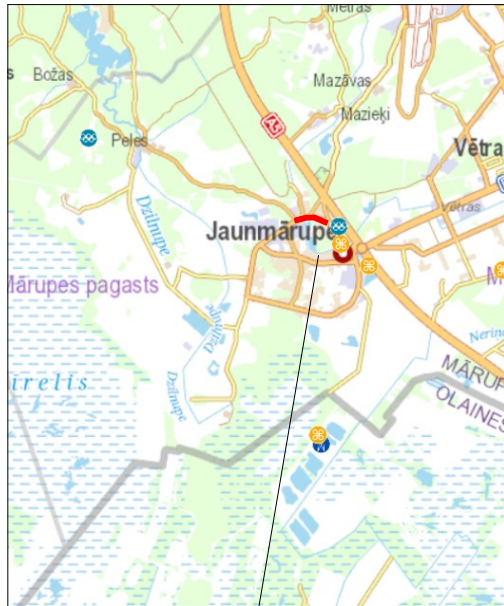
Objekta atrašanās vieta