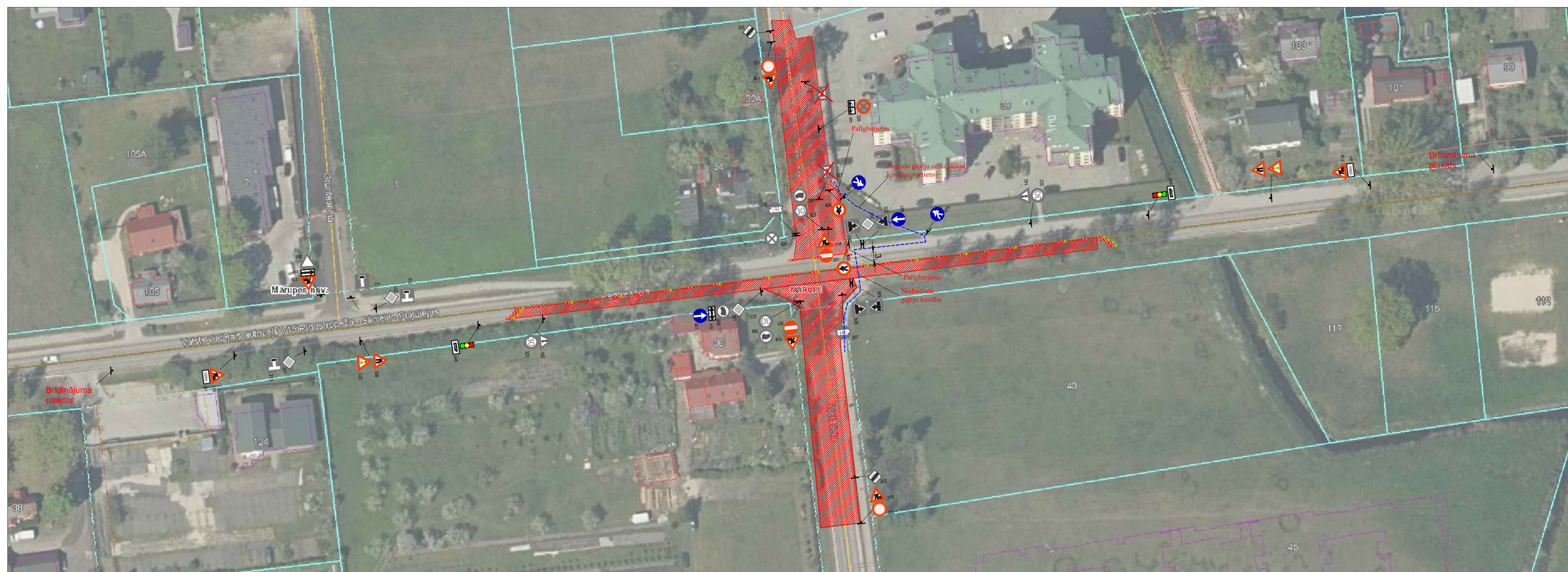
Apbraucama ceļa shēma