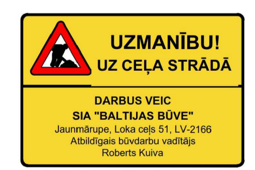
Shēma 1 (BIS-BL-682819-10753)