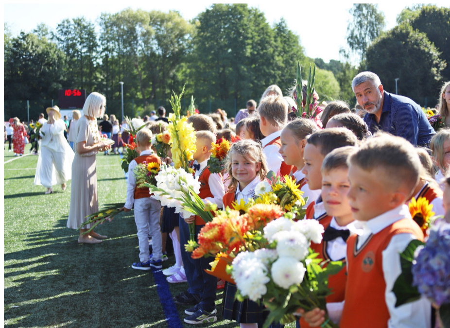
Zinību diena Jaunmārupes pamatskolā.