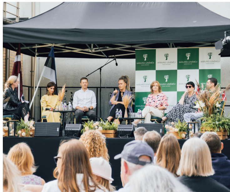
Diskusija "Dzīvo Mārupē, mācies Mārupē" Mārupes Kultūras nama iekšpagalmā.

Uzņēmumu standu izstādē bija pārstāvēti 20 uzņēmumi, kas piesaistīja apmeklētājus ar dažādām aktivitātēm, vienlaikus iepazīstinot apmeklētājus ar saviem produktiem