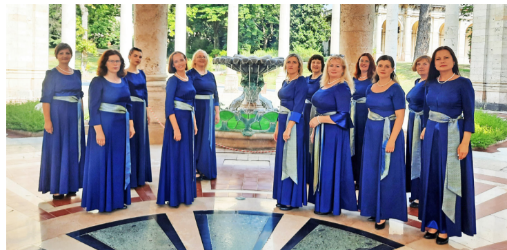
Ansambļa dalībnieces pirms koncerta Tettuccio Terme .

Festivālā ansambļa dziedātājas guva lielisku iespēju redzēt citu valstu kolektīvu muzikālo sniegumu, vērtēt un salīdzināt dažādas mūzikas kultūras un mentalitātes. Sadraudzība izveidojās ar vīru kori no Zviedrijas, un katru dienu norisinājās savstarpēja sadziedāšanās, kas, neraugoties uz valodu dažā-