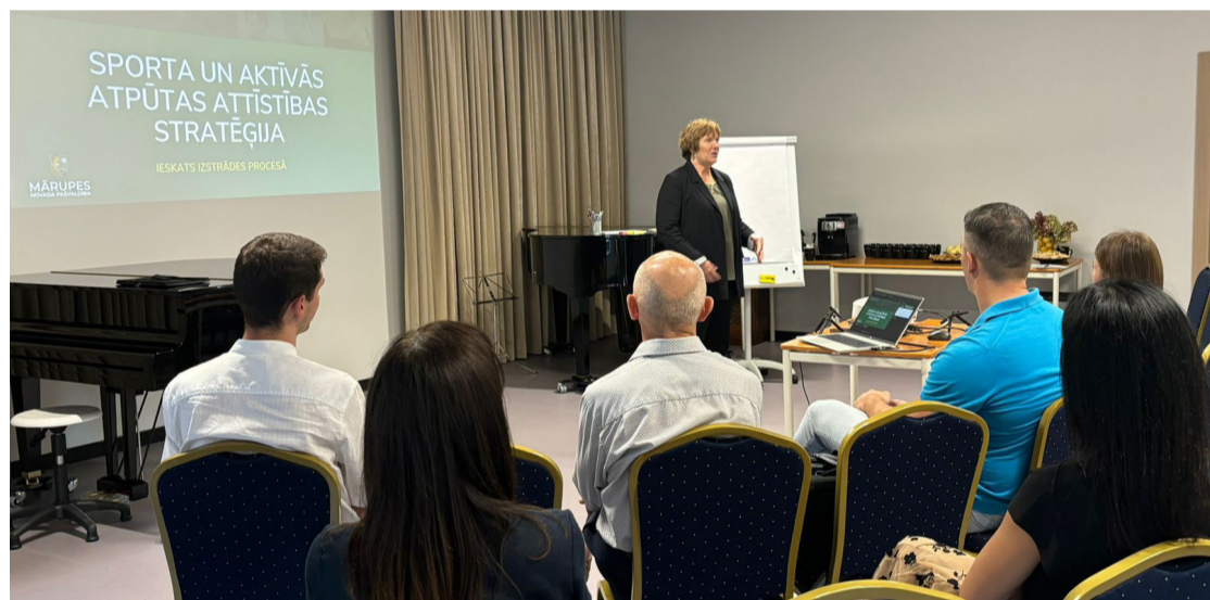
Izglītības un jaunatnes konsultatīvās padomes sēdes dalībnieki diskutē par izglītības jautājumiem novadā.

Attīstības un plānošanas pārvalde, Pašvaldības īpašumu pārvalde