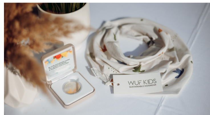
Piemīnas monēta un dāvana, ko saņem mazie novadnieki.

7. septembrī Mārupes Kultūras nama iekšpagalmā pulcējās tās novada ģimenes, kurās līdz šā gada jūlijam be-