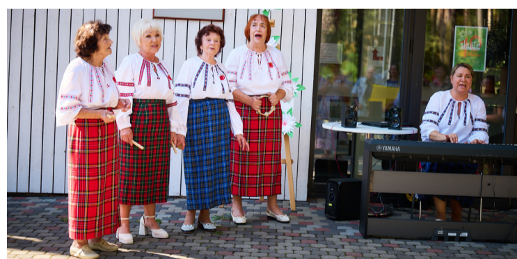
Senioru ansambļa "Mežābele" sveiciens dienas centra "Skulte" jubilejai.