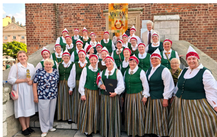
Sieviešu senioru kora "Noktirne" dalībnieces festivālā Polijā.

Prieks par pavadīto laiku saistās ne tikai ar festivālu. Koris iepazinās arī ar Krakovas izcilo vecpilsētu, krāšņo arhitektūru, kas brīnumainā kārtā palika nesagrauta Otrajā pasaules karā. Braucām ar plostiem pa krāčaino robežupi Dunajecu, kas šķir Poliju un Slovākiju, priecājāmies par krāšņo Krakovu, kuļojot pa Vislu; atpakaļceļā paskatījāmies arī uz Zakopanes kalniem un no sirds izpeldējāmies termobaseinos. Vēlā 13. augusta vakarā autobuss apstājās pie Mārupes novada pašvaldības Centrālās pārvaldes ēkas,