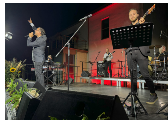
Mirkļi no Brīvdabas mūzikas, teātra un kino vakariem Mārupē.