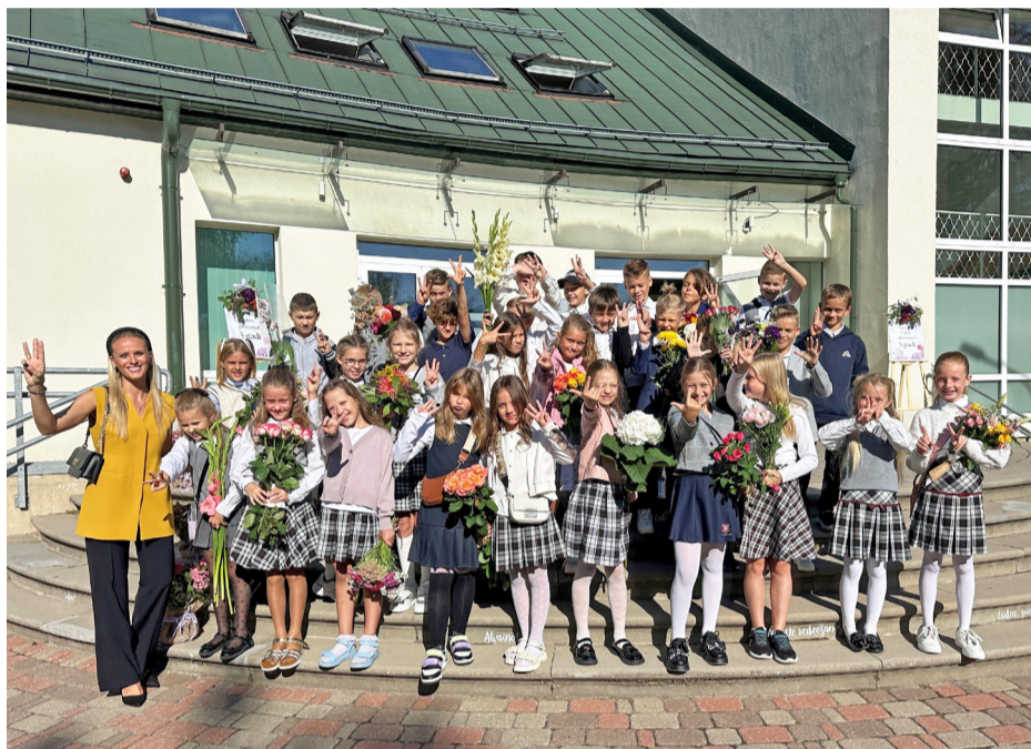
Zinību diena Mārupes Valsts ģimnāzijā.

Mīlie skolotāji! Sveicam Skolotāju dienā! Paldies par jūsu gudrību, iedvesmu un pacietību!