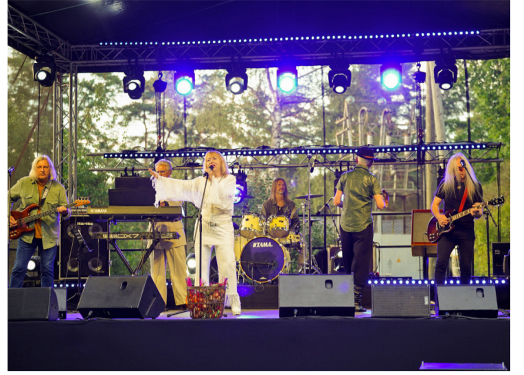
Mirkļi no "SīpolFEST 2024".