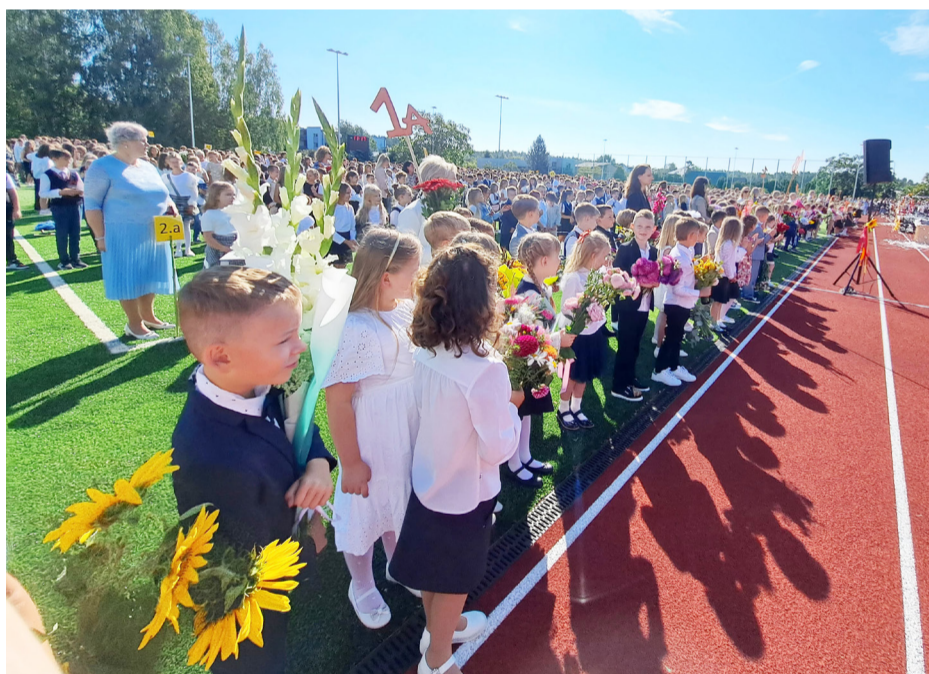
Zinību diena Babītes vidusskolā.