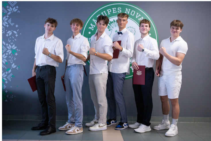
Mārupes novada Sporta skolas pirmie absolventi.

Dalībniekiem būs iespēja piedalīties dažādās vieglatlētikas disciplīnās: