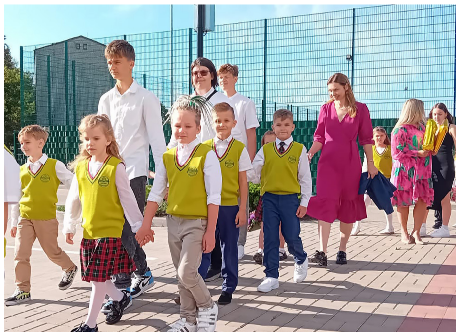
Zinību diena Mārupes pamatskolā.