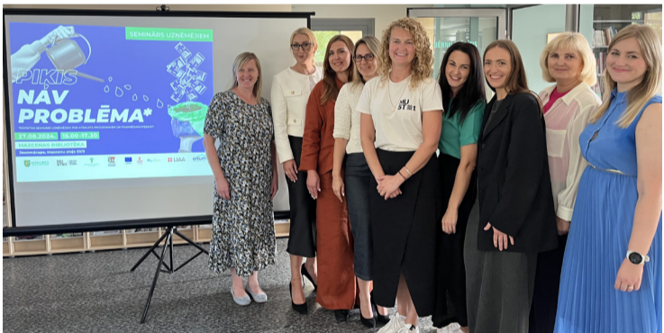
Semināra "Piķis nav problēma" lektori un organizatori.