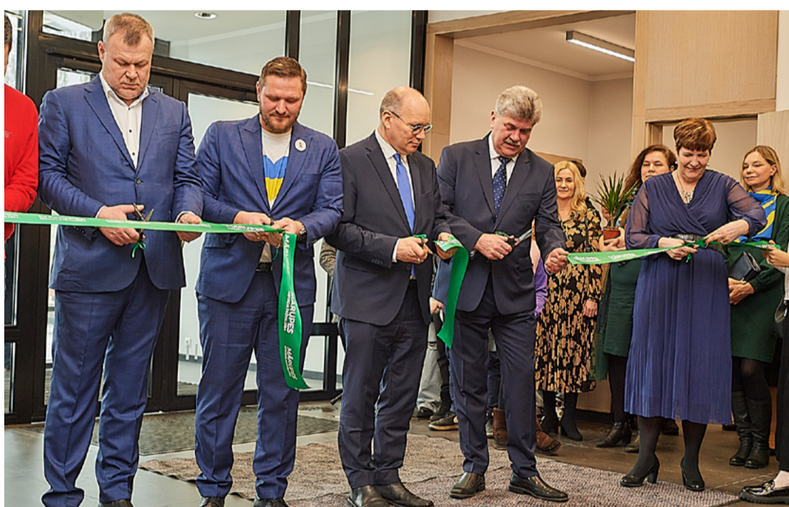
Ar svinīgu lentes griešanu februāra beigās atklāta Mārupes Mūzikas un mākslas skolas pārbūvētā ēka.

"Šī diena mums visiem asociējas ar visu pasauli satricinošu vēsti. Ar dienu, kad pirms gada Krievija uzsāka savu iebrukumu Ukrainā, un ciņas vēl turpinās. Mums visiem šajā trauksmainajā laikmetā ir nepieciešams kāds gaišums, un kas gan labāk dziedē dvēseli, paceļ garu un vieno mūs, kā mūzika un