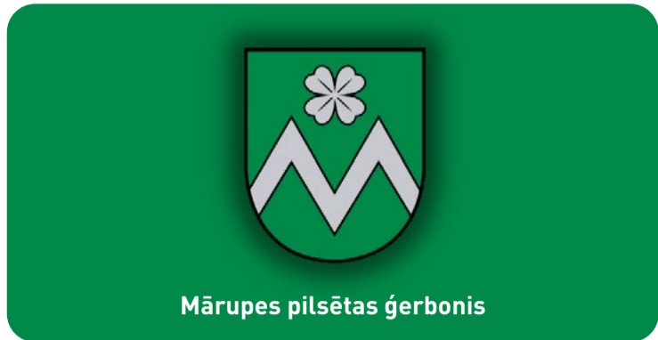
Mārupes pilsētas ģerbonis

Administratīvi teritoriālā reforma aizsāka daudzas pārmaiņas, tostarp apvienoto novadu simbolikā. 2022. gadā tika izstrādāts nu jau tautā iemīļotais jaunais novada ģerbonis ar pupuķi. Mārupes pilsētas dzimšanas dienas priekšvakarā (Mārupe pilsētas statusu ieguva 2022. gada 1. jūlijā) iepazīstinām ar Mārupes pilsētas ģerboni, ko Mārupes novada pašvaldības dome apstiprināja šī gada 26. aprīlī.