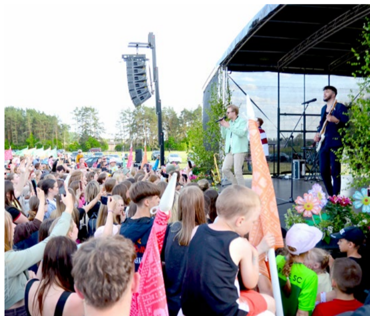
Bērnu un jauniešu svētku "Ar vasaru saujā" noslēgumā - "emociju sprādziens" ar grupu "Citi Zēni".

Ar plašu izklaides un muzikālu programmu, bērnu smiekliem un prieku visas dienas garumā 28. maijā Jaunmārupē aizvadīti šī gada Mārupes novada bērnu un jauniešu svētki "Ar vasaru saujā", atzīmējot veiksmīgu mācību sezonas noslēgumu, vasaras iestāšanos un bērniņu.