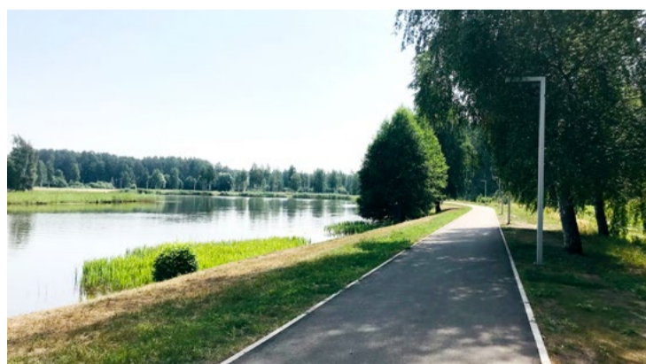
Labiēkārta atpūtas vieta pie Piņķu ūdenskrātuves.

Sabiedrības informēšanas un multimediju nodaļa