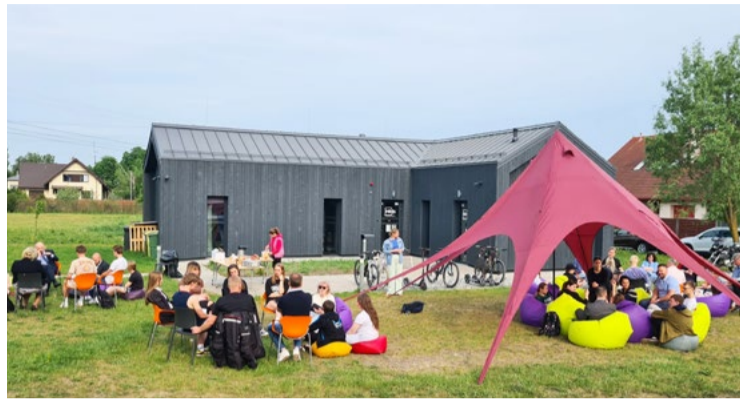
Jaunieši ar Pašvaldības domes deputātiem diskutē par sporta, izglītības, kultūras un jaunatnes jautājumiem.

25. maijā jauniešu centrā “Hēlijs” tika aizvadīts pasākums “Pikniks ar politiķiem”. Šis bija pirmais šāda formāta pasākums Mārupes novadā. Neformālā gaisotnē Mārupes novada jaunieši satikās ar Mārupes novada pašvaldības (turpmāk - Pašvaldība) domes deputātiem, izglītības iestāžu direktoriem, novada uzņēmējiem un citiem aktīviem novada iedzīvotājiem.