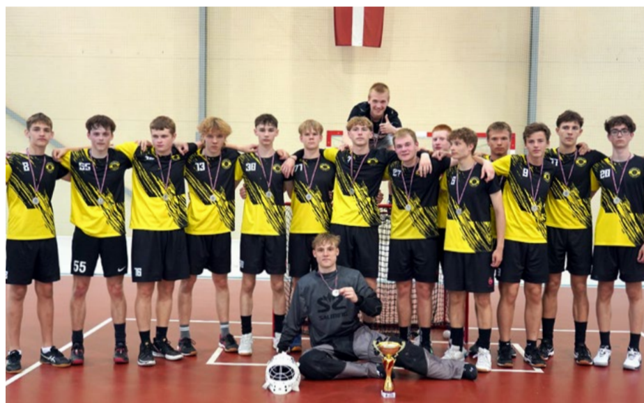
Rīgas atklātā čempionāta florbolā sudraba medaļas ieguvēji - Babītes SK U-16 komanda.