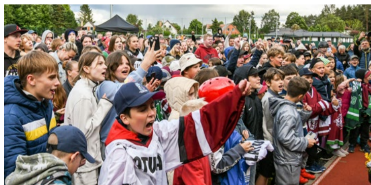
Neviltotas fanu emocijas, sagaidot mūsu novada hokejistus.

Sabiedrības informēšanas un multimediju nodaļa