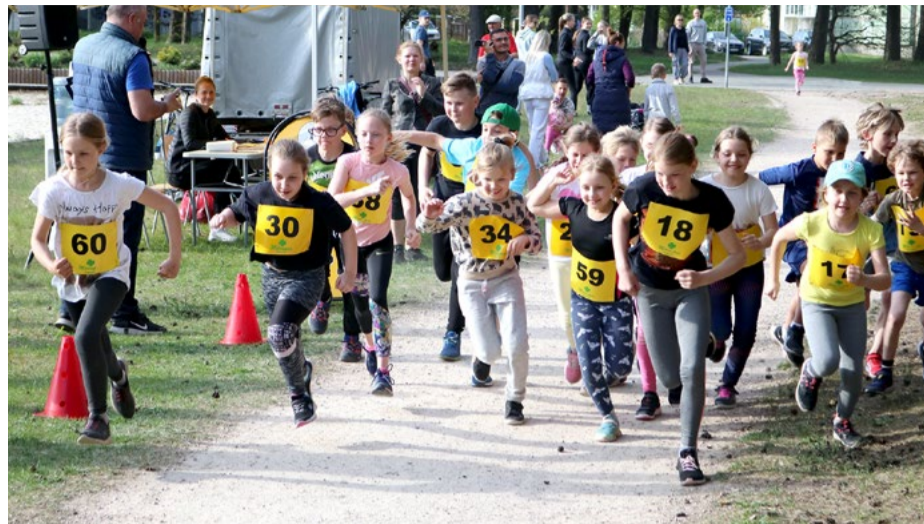
Mārupes Sporta centra pasākums "Pavasara kross Mārupē" skriešanai iedvesmo kā lielus, tā mazus.

Šajā pavasarī Mārupes Sporta centrs iedzīvotājiem piedāvāja iespēju četrus trešdienu vakarus doties skrējienā pasākumā "Pavasara kross Mārupē". Dalībnieku vidū bija dažāda vecuma skriešanas entuziasti, kuri pieveica distances no 200 metru līdz četrus kilometru garam posmam