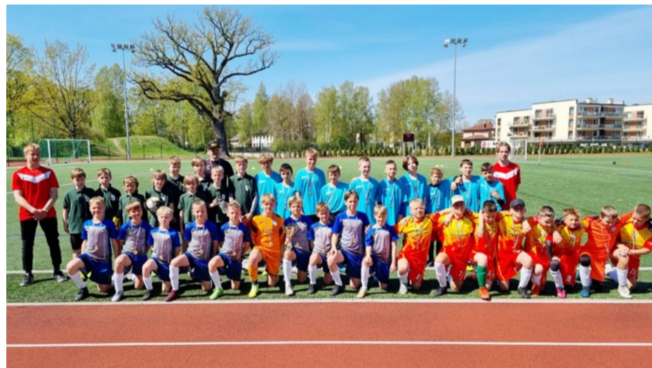
Mārupes novada skolu futbola sacensību dalībnieki.

20. maijā Mārupes Sporta centra pieaugušo futbola komandas futbolisti kļuva par 2. līgas turnīra līderiem. Divu vadošo komandu savstarpējā cīņā Mārupes Sporta centra komanda Jaunmārupē ar 7:0 sagrāva futbola klubu "Aliance". Pārspēks lika par sevi manīt pirmā puslaika vidū, kad pretinieku komanda ieraidīja bumbu savos vārtos. Līdz puslaika beigām mārupieši atzīmējās vēl ar diviem precīziem sitieniem, bet spēli noslēdza kopā ar ievērojamu pārsvaru - septiņu vārtu guvumu.