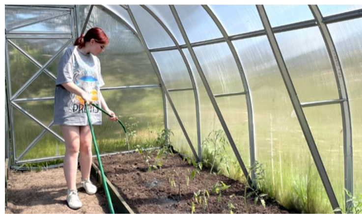
Dārta vasarā izvēlējusies rūpēties par jauniešu centra “Hēlijs” apkārtnes sakopšanu.

Sabiedrības informēšanas un multimediju nodaļa