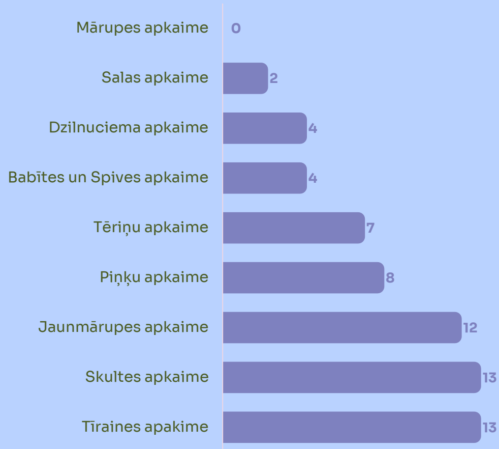
BALSOTĀJU SKAITS PROCENTOS ATTIECĪBĀ PRET IEDZĪVOTĀJU SKAITU