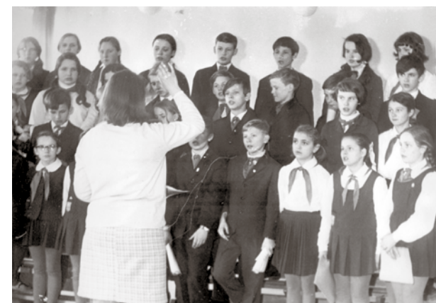
Skolas koris 1971. gadā