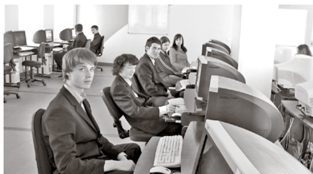
...un 2005. gadā