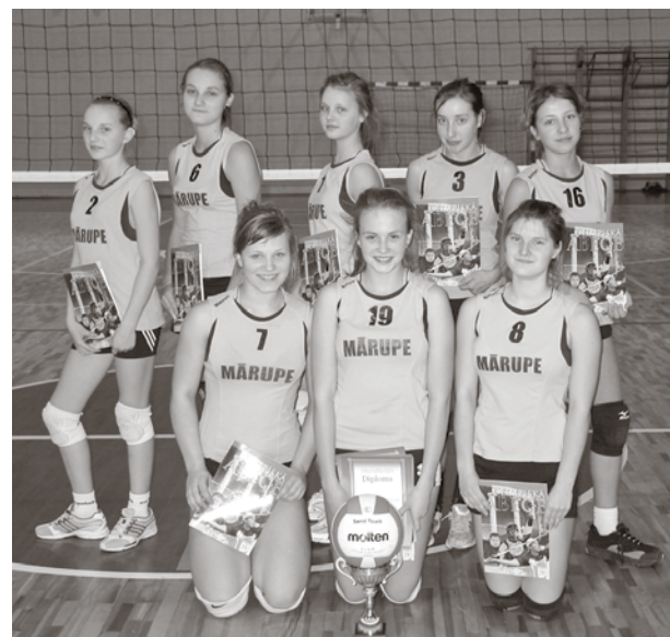
arī 2010 gadā