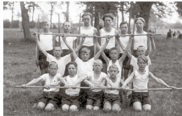
Sportošana Mārupē bija 1934. gadā