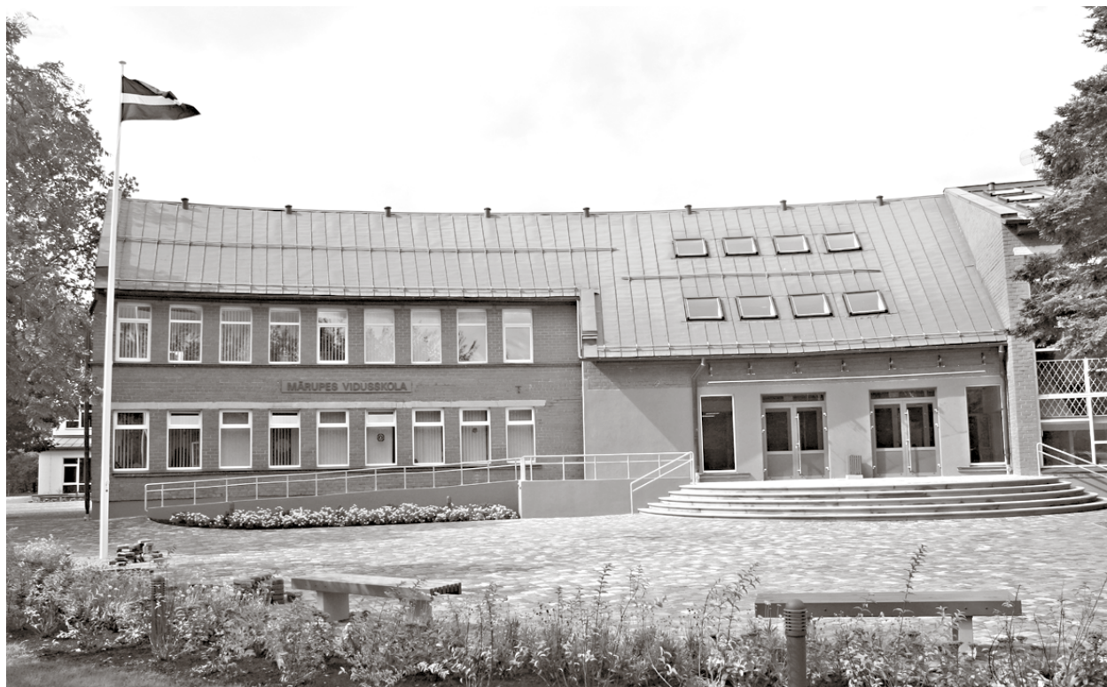
... un 2010. gadā