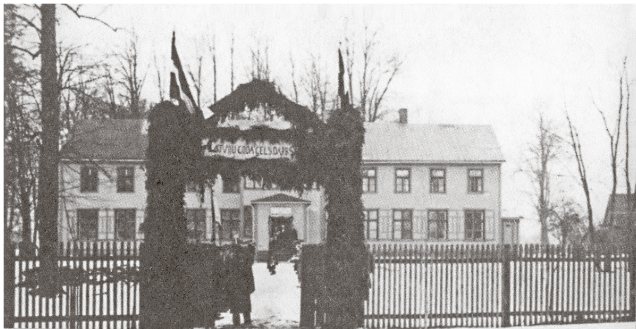
Skola 1936. gadā ...

2004. gads – pabeigta 3. stāva izbūve un klāt nākušas piecas mācību telpas.