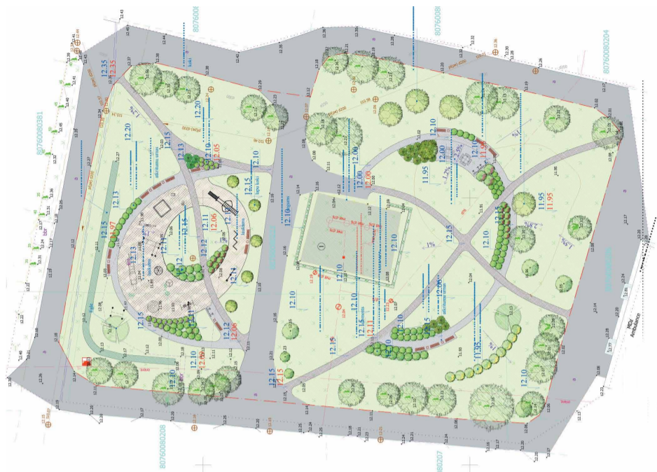
Labiekārtošanas projekts pagalam Viršu ielā

Tīraines ciemā, noslēdzoties ar ūdenssaimniecības infrastruktūras izveidi saistītajiem zemes darbiem, šī gada rudens mēnešos norit pašvaldības īpašumā esošo publisko zaļo zonu labiekārtošana.