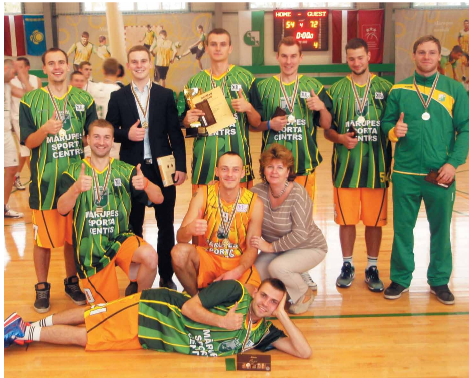
Esam basketbolā labākie jau trešo gadu pēc kārtas