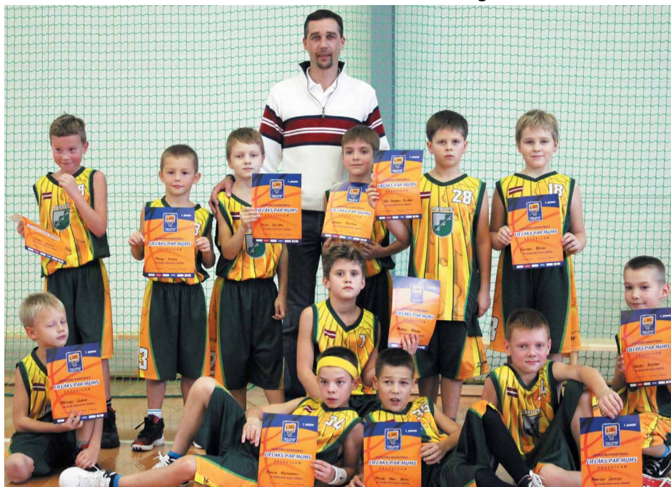
Jaunie basketbolisti lepi par iegūtajām godalgotajām vietām

Šā gada 29. un 30.oktobrī vairākās Latvijas pilsētās norisinājās Latvijas Jaunatnes basketbola līgas rīkoti «Mini kausa» izcīņas turnīri U10 un U11 vecuma grupās. Mārupes Sporta centra komandas veiksmīgi startējušas sacensībās un godam izcīnījušas 1.vietas.