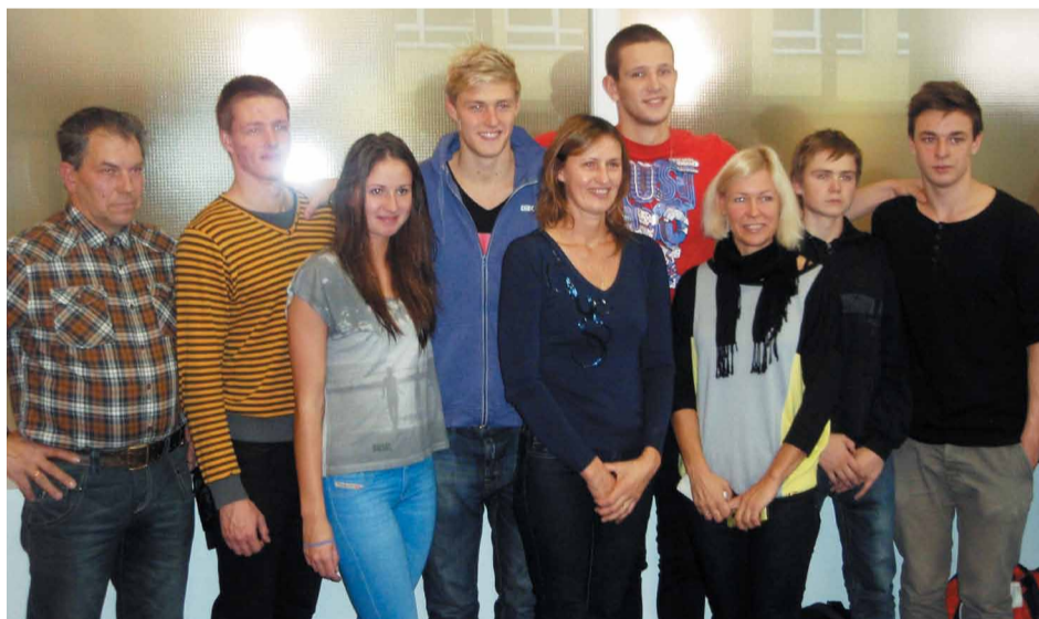
Mārupes novada peldētāju komanda

Oktoobrī Babītē norisinājās Pierīgas novadu 2013.gada sporta spēles peldēšanā. Mārupes sportistiem, gūstot vairākas godalgotas vietas atsevišķās disciplīnās, kopvērtējumā novadam izcīnīts sudrabs.