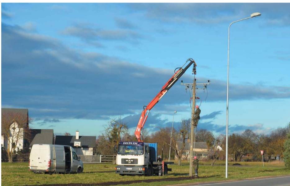
Demontējot veco un uzstādot mūsdienīgu ielu apgaismojumu, drīzumā tiks pabeigta Daugavas ielas izgaismošana līdz pat robežai ar Rīgu

No vasaras norisinās izbūves un projektēšanas darbi vairāku novadu ielu izgaismošanai. Valsts svētku mēnesī gaišāka būs kļuvusi Daugavas iela, tiks uzsākta apgaismojuma izbūve uz Vecā Jelgavas ceļa, kā arī uz Stīpnieku ceļa.