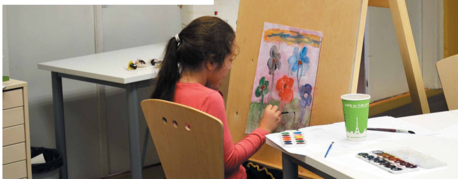
Radošajā darbnīcā bērni var zīmēt, gleznot, veidot un filcēt

Dienas centra „Švarcenieki” bērni un jaunieši labprāt savu brīvo laiku pavada nodarbojoties ar dažādām radošajām aktivitātēm - kopīgi zīmē, glezno, veido un filcē. Nu radošā darbošanās kļuvusi ērtāka un pieejamāka, jo ar Eiropas lauksaimniecības fonda lauku attīstībai atbalstu dienas centram iegādātas vairākas jaunas mēbeles.