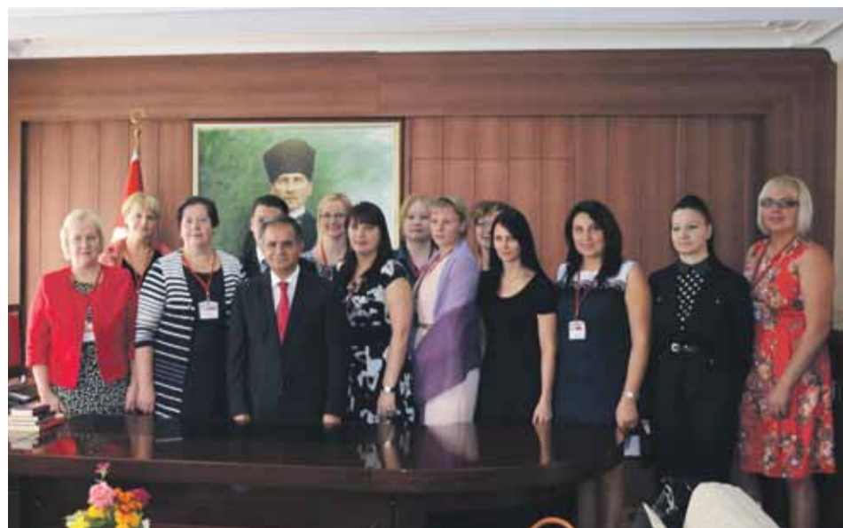
Mārupes pašvaldības darba grupa pieņemšanā pie Kilis provinces mēra Turcijā

Projekta „Ceļā uz iekļaujošu izglītību”, kas ar Eiropas Savienības finansējumu tiek īstenots mūzizglītības programmas Comenius apakšprogrammas Reģionālās partnerības ietvaros, š.g. oktobra beigās Mārupes pašvaldības darba grupa devās vizītē uz Kilis pilsētu Turcijā, lai iepazītu un attīstītu iekļaujošas izglītības īstenošanu abu dalībvalstu pašvaldību izglītības iestādēs.