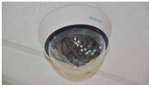
Mārupes vidusskolas video novērošanas sistēma papildināta ar 34 jaunām video novērošanas kamerām

19. „Jaunmārupes sākumskolas rekonstrukcija, pievienojot divas vienstāvēgas koka karkasa rūpnieciski izgatavotas ēkas”, noslēgts līgums ar SIA „TIVO NORD”, līgumcena Ls 299908.67, būvdarbi pabeigti 2012.gada augustā.