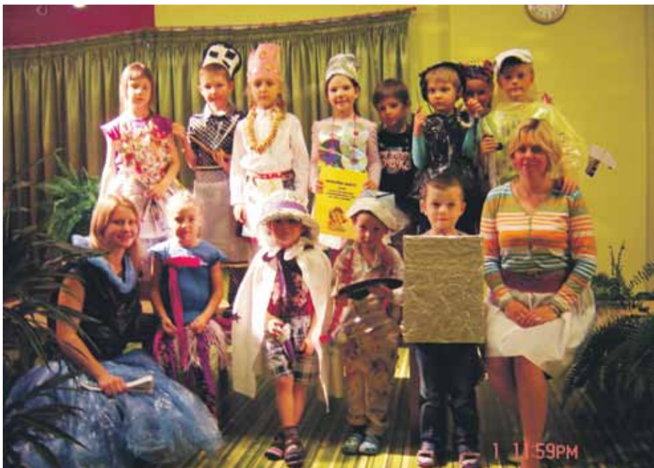
PPII „m`Pipariņa” bērni pašu darinātajos otrās pārstrādes materiālu tērpos

Rudens ir atnācis ne tikai ar savu skaistumu, aukstumu un nemieru, bet arī ar jaukām, radošām idejām. Tās, gluži kā kokam birst raibu raibās lapas, bira PPII „m`Pipariņa” „Nepieradinātās modes” skatē.