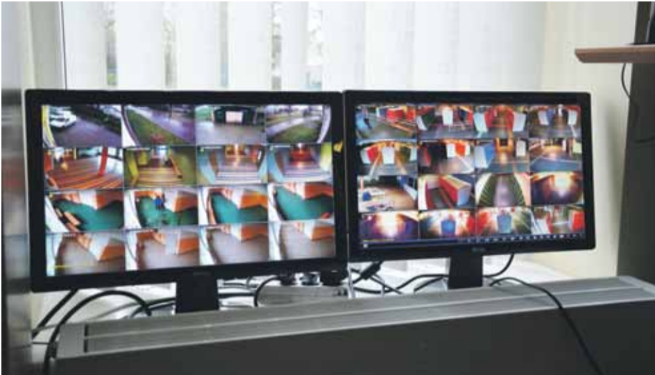
Mārupes vidusskolā uzstādīti divi jauni video novērošanas monitori