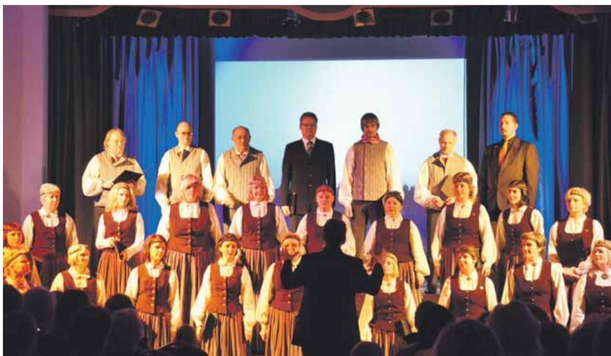
Kora dalībnieki jubilejas koncerta pirmajā daļā klausītājus priecēja ar klasisko kora mūzikas repertuāru

Savas pastāvēšanas 35 gadu jubileju 3.novembrī ar emocionāli piesātinātu un atraktīvu koncertu nosvinēja jautrais koris „Mārupe”.