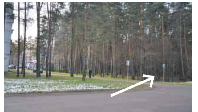
Dienas centra plānotā atrašanās vieta Skultes ielā 31