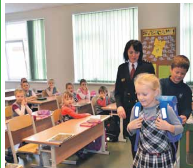
Bērni pārliecinās, ka mantas somās ir jāsargā