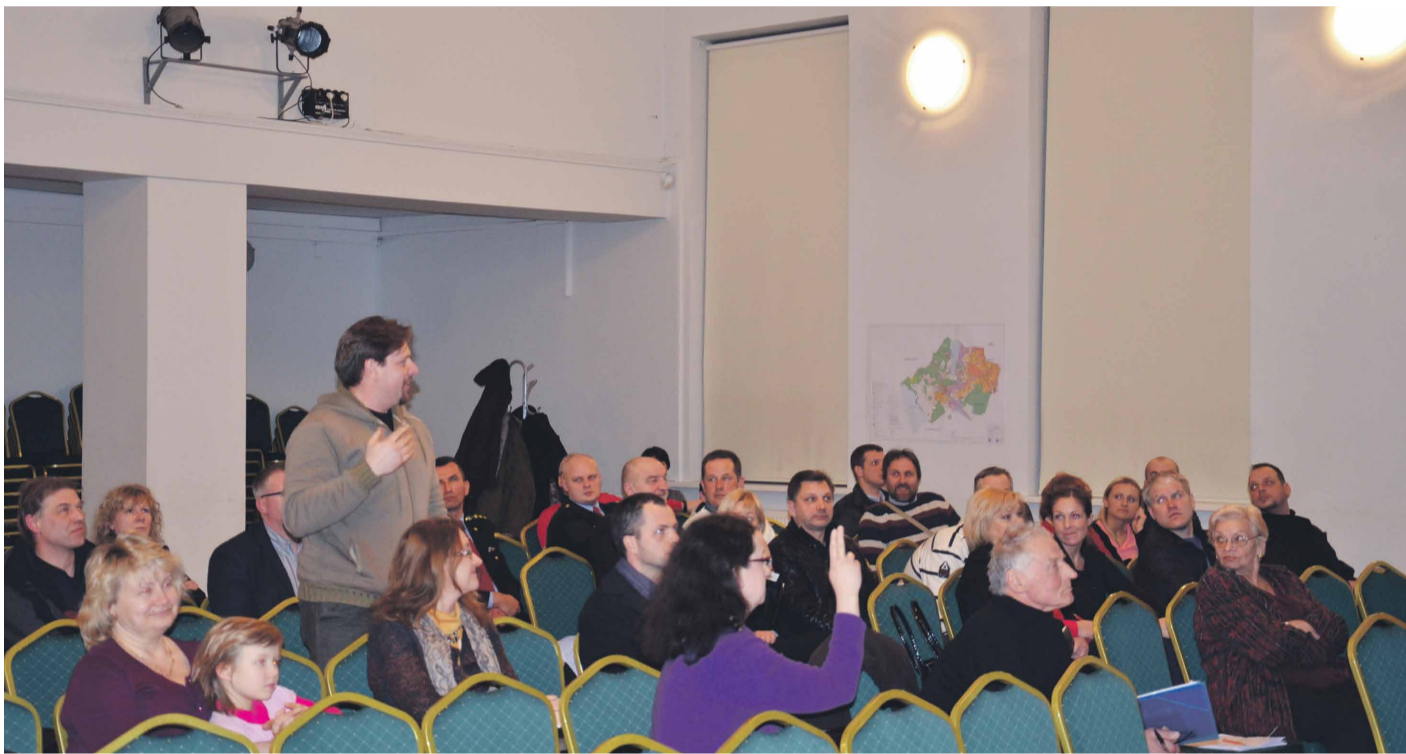
Iedzīvotāji Mārupes Kultūras namā diskutē par Mārupes novada teritorijas plānojuma 2014. – 2016.gadam pilnveidoto 1.redakciju

Laika posmā no 21.02.2013. līdz 15.03.2013. publiskai apspriešanai tika nodota Mārupes novada teritorijas plānojuma pilnveidotā redakcija. Interesenti ar izstrādāto pilnveidoto redakciju varēja iepazīties Mārupes novada Domē izdruku veidā, Mārupes novada mājas lapā www.marupe.lv , kā arī iepazīties, uzdot interesējošus jautājumus un iz-