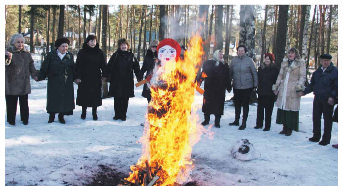
Saskaņā ar tradīciju, atvadoties no Masļeņicas tiek dedzināta salmu lelle