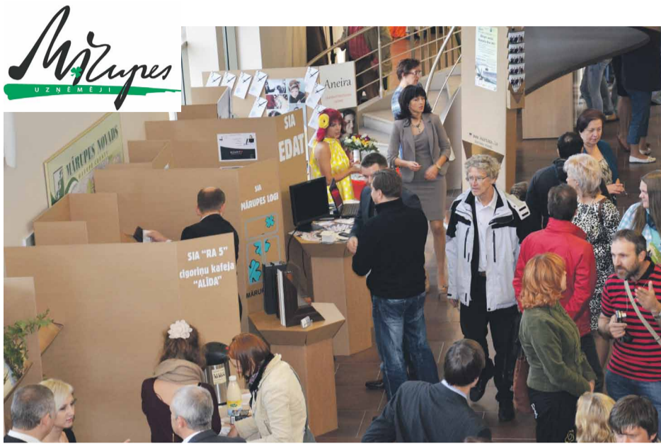
Pirmo reizi biedrības rīkotā "Mārupes Uzņēmēju diena 2012"