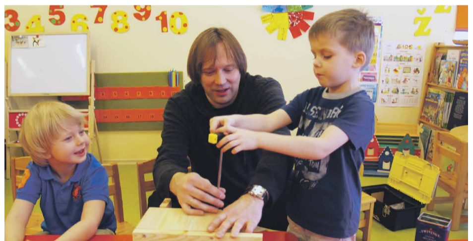
Tēvu labo darbu nedēļā top putnu būriši