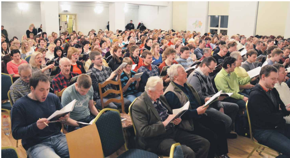
Babītes kori „Atskaņa” un „Maska”, Ķekavas „Mozaīka”, Baldones „Tempus”, Baložu „Zemdega”, Vecumnieku „Maldugunis” Jūrmalas „Lira”, „Spārnos”, „Jūrmala”, „Vaivari” un pašmāju kori „Universum” un „Mārupe” gatavojas Dziesmu svētkiem Mārupes Kultūras namā

No š.g. 30.jūnija līdz 7.jūlijam norisināsies XXV Vispārējo latviešu dziesmu un XV Deju svētki, kuros Mārupes novada gatavojas pārstāvēt teju 200 dziedātāji un dejotāji.