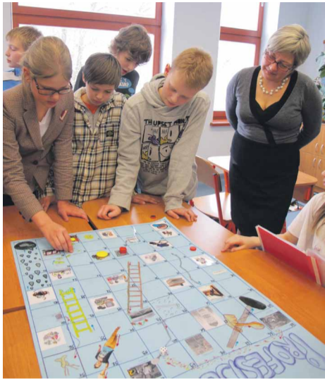
5.a klases skolēnu projekta prezentācija, kas izveidota kā spēle „Profesiju cirks” ar 22 projektu nedēļā iepazītajām profesijām

Laikā no 2013.gada 11.februāra līdz 15.februārim Jaunmārupes sākumskolā tika novadīta un izvērtēta projektu nedēļa, kas šajā mācību gadā tika pakārtota karjeras izglītībai ar nosaukumu „Profesijas”. Projektu ietvaros tika izpētīta profesiju dažādība, bērni iepazīs un tikās ar vecākiem - dažādu profesiju pārstāvjiem, tika izveidota izziņošanas spēle par profesijām un uzfilmēta filma. Katrā klasē tika izstrādātas projektu darbu mapes, izveidotas prezentācijas un plakāti.