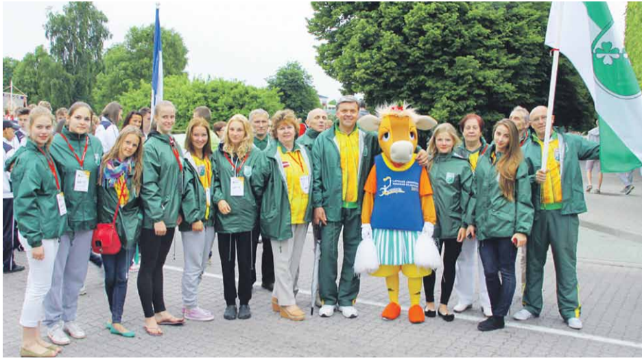
Mārupes delegācija olimpiādes gājienā Ventspilī

No Latvijas Jaunatnes vasaras olimpiādes, kas jūnija vidū četras dienas norisinājās Ventspilī un vairākās citās Kurzemes pilsētās, Mārupes jaunie sportisti atgriezušies ar zelta, sudraba un bronzas medaļām.