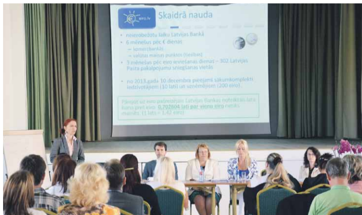
Mārupes uzņēmēji skaidro sev interesējošus jautājumus par pāreju uz eiro

2013. gada 3. jūlijā Mārupes Kultūras namā notika Mārupes novada Domes organizēts seminārs uzņēmējiem un pašvaldību darbiniekiem par eiro ieviešanas jautājumiem „Kā praktiski sagatavoties eiro ieviešanai?”.