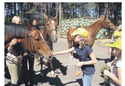
Indiāņu dienā "mazie indiāņi" iepazīstas ar zirgiem