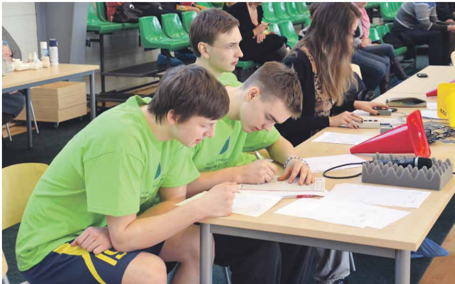
Četri jaunieši kā brīvprātīgie šogad piedalījās starptautiskā basketbola turnīra „Marupe Cup 2013” organizēšanā

Sākot ar 2013.gadu jauniešiem, kas brīvprātīgi darbojas novadā, tiek izsniegti Apliecinājumi par brīvprātīgā darba veikšanu. Šādus apliecinājumus saņēmuši jau 13 jaunieši gan kā pateicības par atsaucību un brīvprātīgā darba popularizēšanu ar savu līdzdalību dažādos Mārupes novada pasākumos, gan kā papildinājumu savam CV un darba pieredzei.