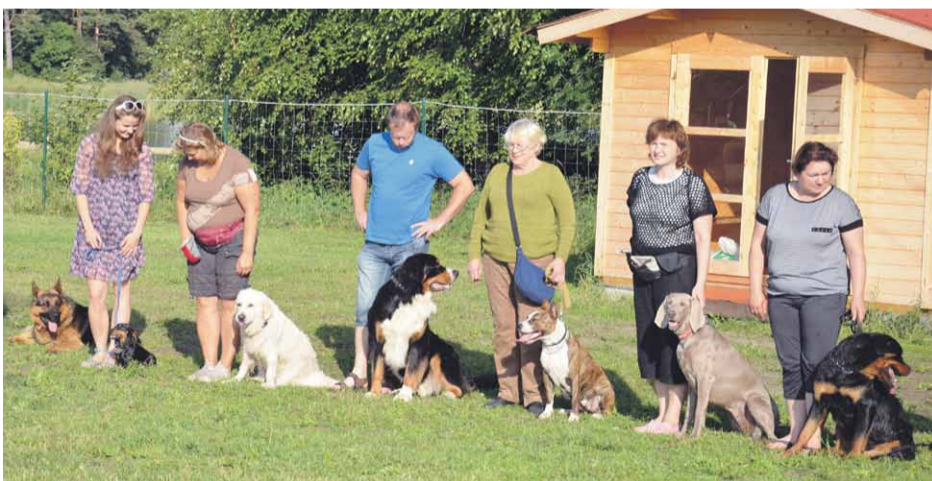
Suņu apmācība z/s "Jaunmārtiņi" Jaunmārupē

Cilvēks, iegādājoties kucēnu vai tiekot pie jau pieauguša suņa, iedomājas, ka suns kļūs par gudru, paklausīgu un uzticīgu draugu. Ar kuru būs viegli un, ja viņš pieder pie dienesta šķirnēm, tad arī droši. Kuru var ņemt visur līdzī un kurš nesagādās nekādas problēmas.