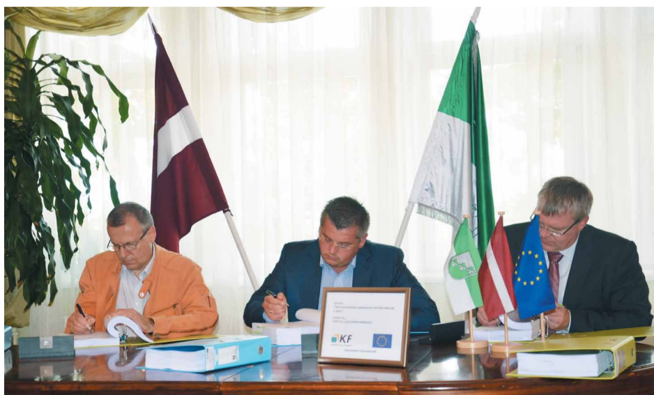
Parakstīts līgums par Mārupes ūdenssaimniecības attīstības projekta II kārtu

Lai nodrošinātu ūdenssaimniecības infrastruktūras attīstību Mārupes novadā, 2.jūlijā parakstīti līgumi par būvdarbu veikšanu projekta „Mārupes ūdenssaimniecības infrastruktūras attīstība, II. kārtā” ietvaros. Projekta kopējās izmaksas ir 6,7 miljoni eiro, bez PVN, un tā īstenošana tiks veikta ar Eiropas Savienības Kohēzijas fonda (KF), Valsts budžeta un Mārupes novada Domes finansiālu atbalstu.