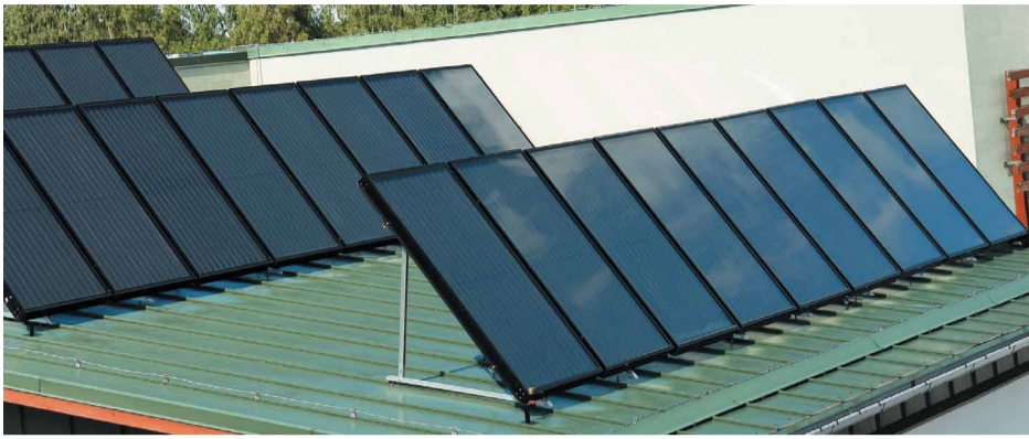
Uz Jaunmārupes pamatskolas jumta uzstādīti saules kolektori siltā ūdens sagatavošanai

Mārupes pašvaldība Jaunmārupes pamatskolā projekta ietvaros šogad uzstādījusi saules kolektorus siltā ūdens sagatavošanai un saules baterijas, kas nodrošinās daļēju ēkas elektroenerģijas patēriņa izmaksu ietaupījumu. Papildus veic arī daļēja apgaismojuma sistēmas nomaiņu, uzstādot izglītības iestādes telpās 140 energoefektīvas spuldzes.