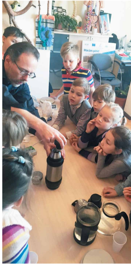
2.a klases skolēni LU Dabaszinātņu un matemātikas centrā

Mūsu 2.a klases projektu nedēļas tēma bija “Mūsu vecāku profesijas”. Nedēļas garumā piedalījāties daudz un dažādās aktivitātēs.