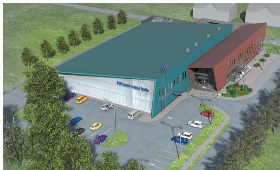
Paredzamās Mārupes ledus halles vizualizācija

Mārupes novada Dome 2015.gada 25.februāra domes sēdē pieņēma lēmumu Nr.12 „Par nekustamo īpašumu Kantora iela 126 (kadastra Nr. 80760031013), Kantora iela 128 (kadastra Nr. 80760031003) un Sņķeru iela 18 (kadastra Nr. 80760031685), Mārupē, Mārupes novadā, detālplānojuma projekta nodošanu publiskajai apspriešanai”.