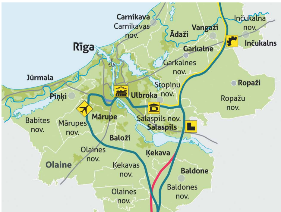
Karte Nr.1, R7 izvirzītais risinājums ietekmes uz vidi novērtējuma procedūrai