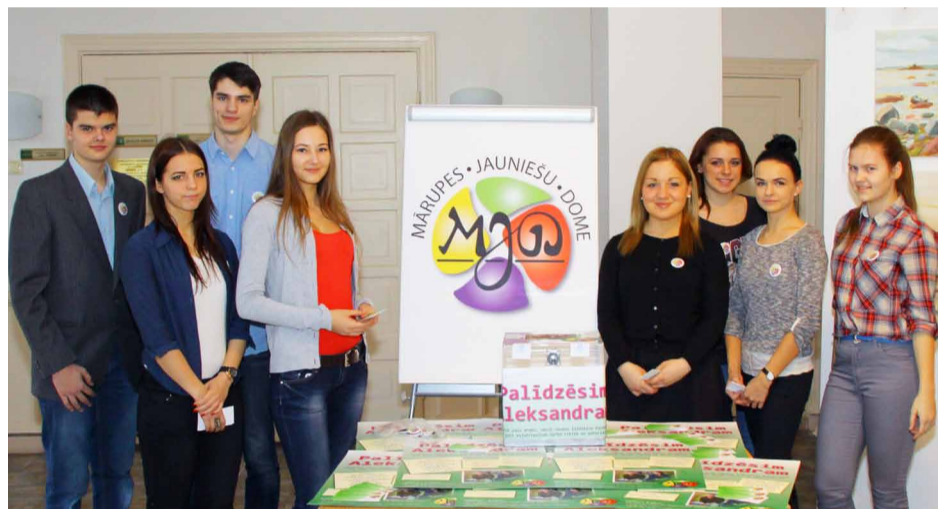
Jauniešu Domes jaunieši organizēja informatīvu stendu

22.februārī Mārupē un vēl 100 vietās Latvijā rādīja "Ghetto games" filmu "Tas ir tikai sākums", kuras laikā mēs pirmo reizi prezentējām sevi kā Mārupes Jauniešu Domi. Organizējam nelielu