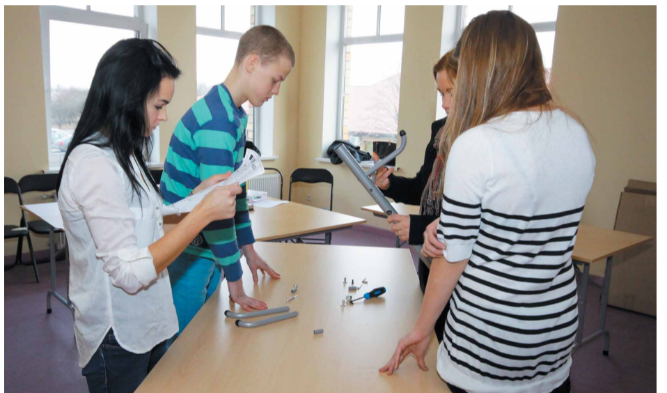
Iekārtojamies jaunajā Jauniešu Domes telpā

Kad būsīm iekārtojušies, rīkosim savas telpas atklāšanu un aicināsim visus ciemos!