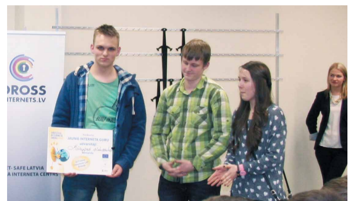
Mārupes vidusskolas komanda saņem augstāko žūrijas vērtējumu

Dienas noslēgumā notika apbalvošana, kurā visām komandām tika pasnieg-