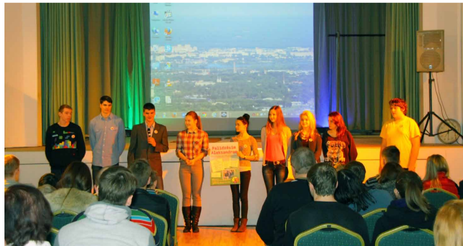
Popularizējam Labdarības akciju un stāstām par sevi Ghetto games filmas atklāšanā

Februārā beigās mūs uzaicināja uz Jauniešu studijas "BaMbus" atklāšanu. Tā ir daudzfunkcionāla, organiska, atraktīva un progresīva vieta, kur jaunieši caur dažādām aktivitātēm var apgūt un pilnveidot savas prasmes, iegūt jaunu pieredzi,