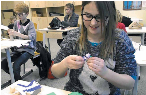
Konkursā dalībnieki demonstrēja gan prasmes darboties ar papīru un citiem materiāliem, gan izdomu, radot oriģinālus darbu maketus

12. februārī Mārupes pamatskolā, kur kopš rudens darbojas arī Mārupes Mūzikas un mākslas skola (MMMS) Tīraines bērniem, Vizuāli plastiskās nodaļas audzēkņi piedalījās Valsts konkursā „Es. Telpa. Vide.” pirmajā kārtā, radot vīzijas par novada vides labiekārtošanu.