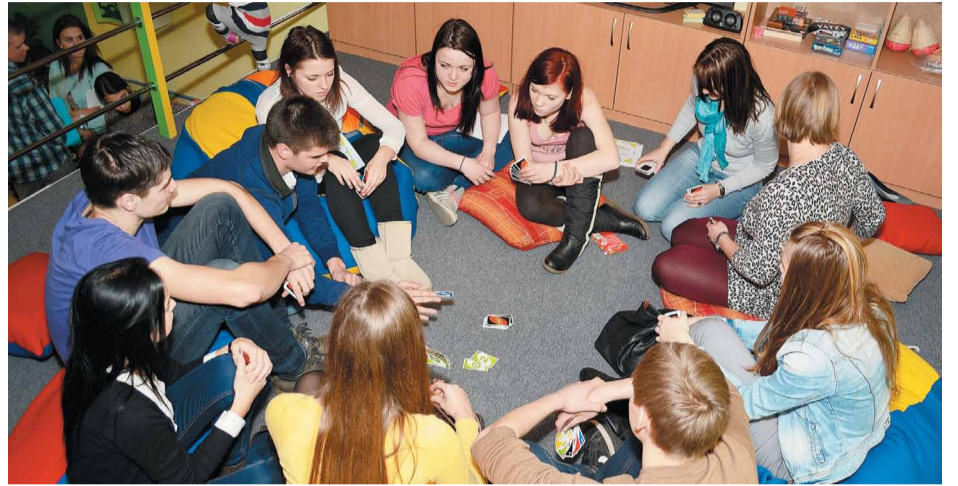
Iepazīšanās spēle jaunajā studijā "BaMbus"

Lai mēs visi tuvāk iepazītos un sadraudzētos, februāra vidū izlēmām Jauniešu Domes sēdi organizēt neformālā gaisotnē un apspriest mūsu plānus izbraukumā. Mēs ne tikai veselīgi pavadījām laiku, izkustējāmies un nesēdējām telpās, bet arī uzņēmām pāris kadrus topošajai filmiņai par Jauniešu Domes aktivitātēm.