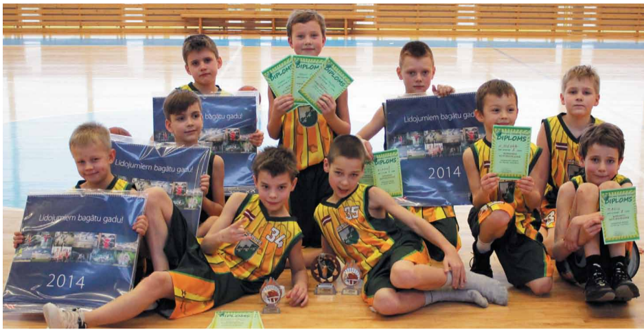
Komandu sacensībās labākos rezultātus uzrādīja Mārupes „Monstriņi”

15.februārī Tiraines sporta kompleksā norisinājās Mārupes Sporta centra (SC) rīkotā Basketbola Tehnikas Diena 2004.g.dzimušiem un jaunākiem zēniem. Sacensību laikā tika noskaidroti ātrākie un izveicīgākie sportisti dažādu basketbola tehnikas elementu izpildīšanā.