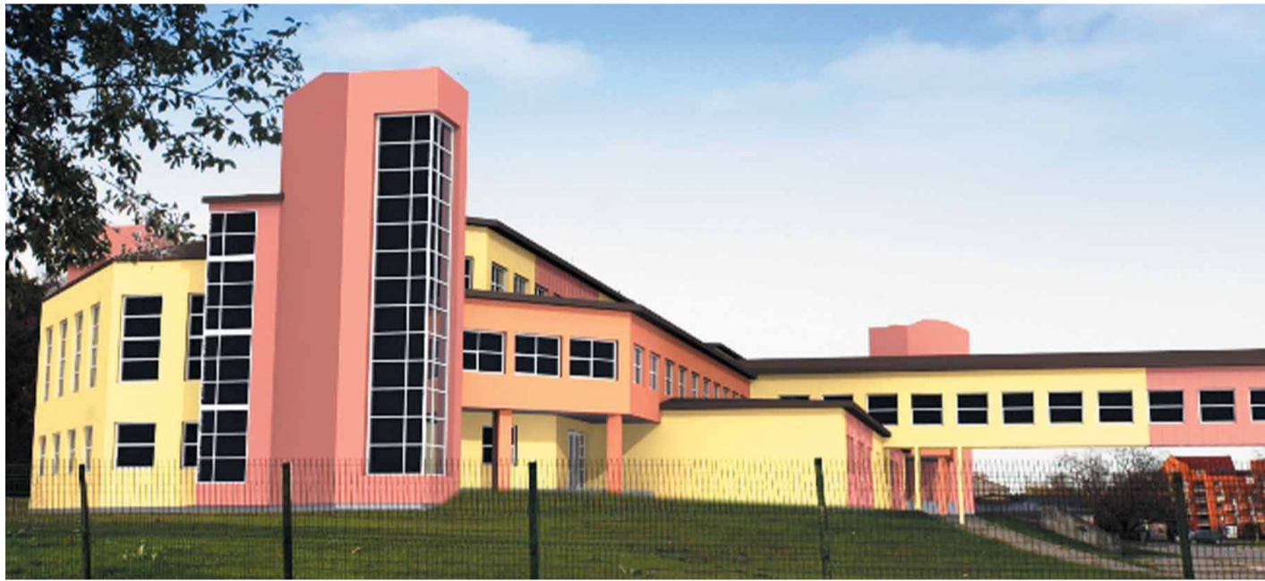
Rekonstrukcijas projekta vizualizācija, autors SIA Baltex Group

11.februārī Mārupes pašvaldība slēgusi līgumu par ēkas rekonstrukcijas un teritorijas labiekārtošanas darbu uzsākšanu īpašumā Mazcenu alejā 3, kur no š.g. 1.septembra paredzēts atvērt Jaunmārupes pamatskolu. Jaunmārupes sākumskolas rekonstrukcija par pamatskolu paplašinās pamatizglītības iegūšanas iespējas novadā, kas līdz ar pamatskolas vecuma bērnu skaita pieaugumu Mārupes pašvaldībai ir aktuāli risināmais jautājums.