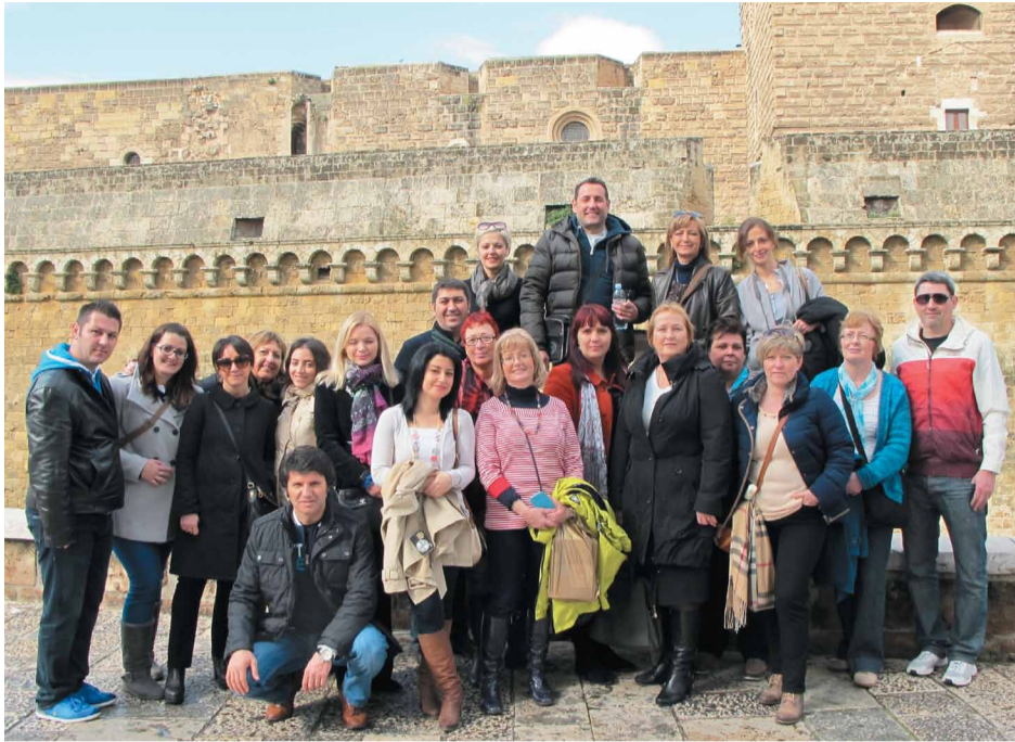
Projekta partnervalstu otrā tikšanās reize, šoreiz - Itālijā

No šī gada 5. līdz 9. februārim Itālijā notika Jaunmārupes sākumskolas koordinētā COMENIUS projekta „The Wonders of Solstice” jeb „Brīnumainie saulgrieži” otrā partnervalstu tikšanās reize. Sešu projekta dalībvalstu pedagogi no Latvijas, Turcijas, Spānijas, Grieķijas, Apvienotās Karalistes un Polijas, kā arī četri poļu skolēni viesojās Itālijas dien-