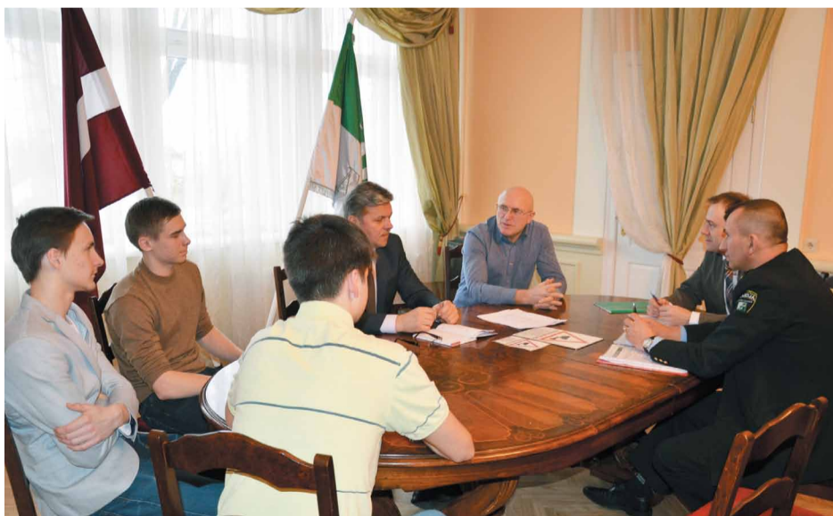
Ēnotāji piedalās darba sanāksmē par sabiedriskās kārtības jautājumiem

12.februārī karjeras izglītības akcijā jeb Ēnu dienā visā Latvijā jaunieši devās ēnot sev interesējošas profesijas, tuvāk iepazīstot nākotnes nodarbes specifiku. Lai dotu iespēju jauniešiem ielūkoties pašvaldības darbā, šogad pirmo gadu projektā iesaistījās arī Mārupes Dome.