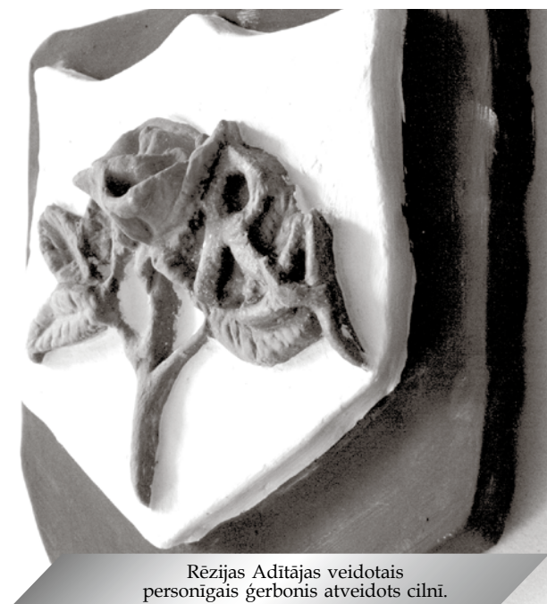
Rēzijas Aditājas veidotais personīgais ģerbonis atveidots cilnī.

Mārupes mūzikas un mākslas skola aicina pieteikt uz rotaļu grupiņām bērnus no 1,5 līdz 3,5 gadu vecumam. Nodarbības notiek divas reizes nedēļā.