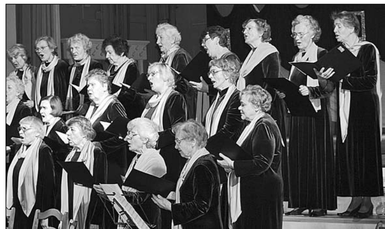
“Noktirne” arī Madonā izcēlās ar savu eleganci.