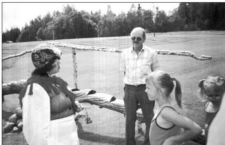
Kazu Frīda Kāzu muzejā

Alūksne un Rauna. Ceļojumā iepazīties ar Alūksnes 14. gs. celto pili, vienu no nozīmīgākajiem Livonijas austrumu robežas nocietinājumiem. Līdzās skaistajam parkam ievēribo pelna 1937. gadā celtais saules tilts, kas atrodas pie Tempļa kalna.