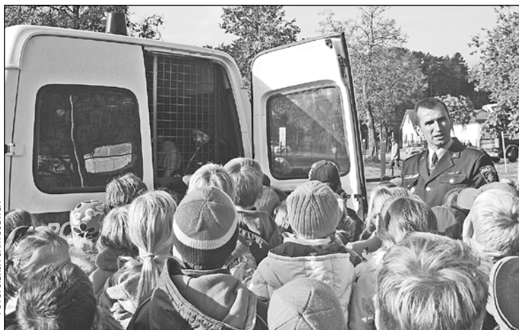
Drosmīgākajiem bija iespēja pasēdēt “aiz restēm” policijas automašīnā.