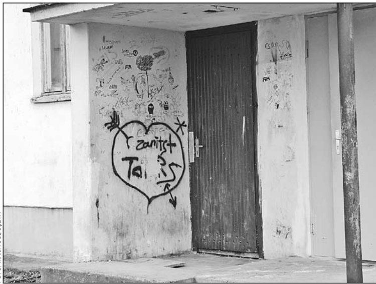
Mazcenu alejas 27. mājas ieeja. Protams, tāda nebūt nav vienīgā.

Silvija Veckalne, SIA "Sabiedrība Mārupe" sabiedrisko attiecību speciāliste