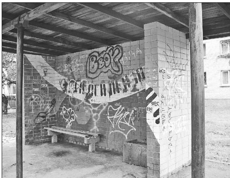
Pirms dažiem gadiem Mārupes mūzikas un mākslas skolas audzēkņi ar lielu aizrautību autobusu pieturas Jaunmārupē padarīja košas un pievilcīgas. Diez vai otrreiz viņi to darīs.