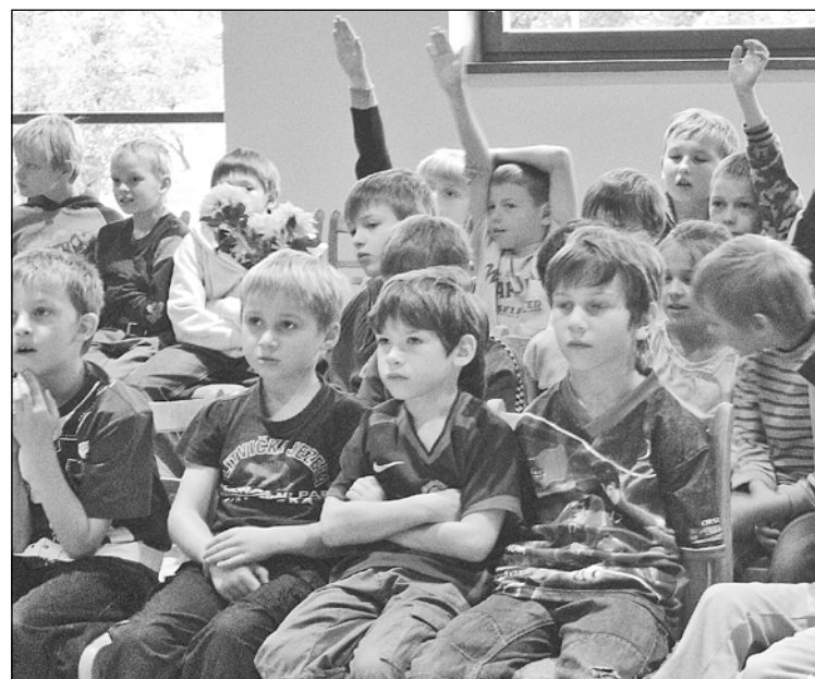
Skolas zālē daudzi klausījās policistus ļoti uzmanīgi.