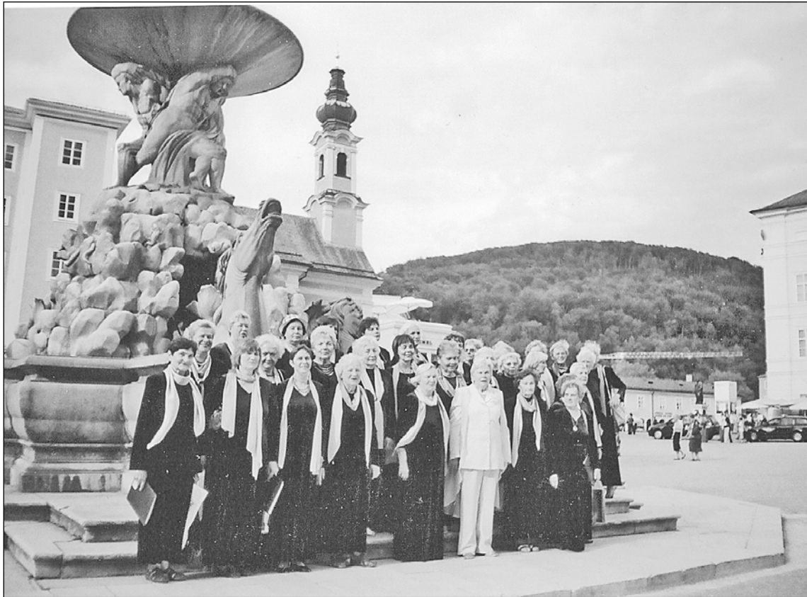
"Noktirne" Zalsburgā pēc uzstāšanās Doma katedrālē.

Kora "Noktirne" kolektīvam ir noslēdzies atkal viens skaists piedzīvojumu bagāts ceļojums – no šā gada 22. līdz 29. augustam bijām ekskursijā Austrijā, Bavārijā, Morāvijā. Jāsaka liels paldies mūsu pagasta valdei par dāsno dāvanu kora 35 gadu jubilejā – dāvanu karti ārzemju ceļojumam. Tā mūsu pašu maciņos palika kāds lats vairāk.