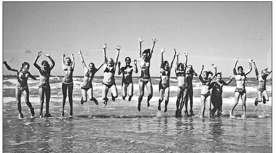
Mārupes jaunās volejbolistes vasarā krāja spēkus jaunajai sezonai – nometnē Ventspilī.