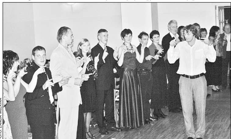
Ritmikas stunda sākās ar pirkstu vingrinājumiem.