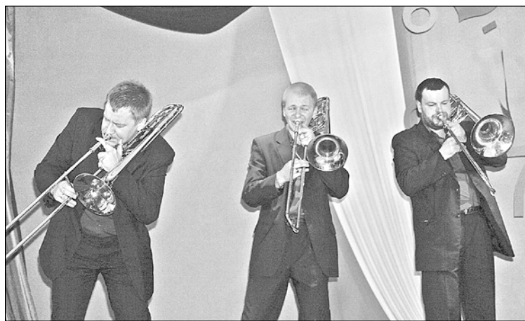
Atraktīvie mūzikas “skolotāji” skaņdarbus ne tikai spēlēja, bet pat ... izdejoja.