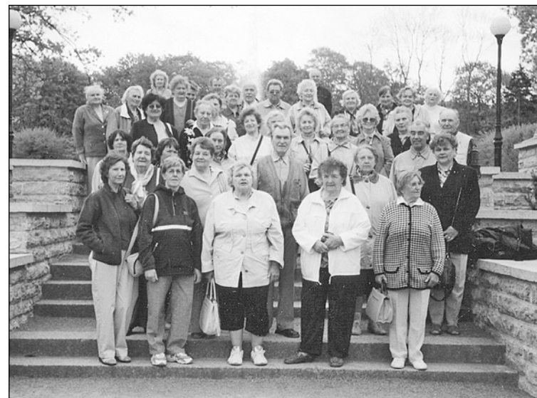
Ziemeļigaunijā parkā pie jaunā mākslas muzeja Kumu.

Noorganizējām arī vienas dienas braucienu ar kuģīti pa