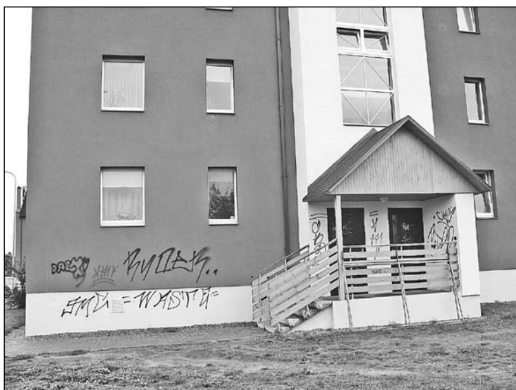
Mazcenu alejas 10. māju sāka apdzīvot salīdzinoši nesen gan iedzīvotāji, gan "mākslinieki".