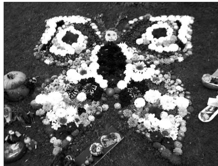
Pļaviņā bija nosēdies krāšņs ziedu taurenis.

Pasākumu apmeklēja, vēroja un atzinīgi novērtēja arī Rīgas rajona pirmsskolas izglītības iestāžu mūzikas pedagogi no Piņķiem, Ķekavas, Saulkrastiem, Sējas, Siguldas, Tiraines u.c.