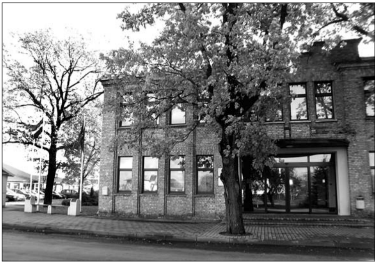
« Sākums 1. lpp.

Tiek rasti blēdīgi ceļi, lai veidotu kopīpašumu ar pašvaldību, tādējādi tuvāk piekļūstot fondu finansējumam, kura summa ir iespaidīgi liela – apmēram 5,6 miljoni latu! Esam nonākuši pat līdz tādām absurdām, ka no SIA “Mārupe” ir saņemti 15 privatizācijas pieteikumi uz pašvaldības īpašumiem – Jaunmārupes ūdenstorni, siltuma trasēm, atīrīšanas iekārtām un pat uz visu komunālās saimniecības uzņēmumu. Tad līdz Mārupes pagasta izputināšanai atliek viens vienīgs solis – politiskais balsojums –, un visi Mārupes pašvaldības īpašumi un pamatlīdzekļi nonāks privātās rokās. Tad mūsu Mārupes pašvaldība tiks pilnībā izlaupīta!