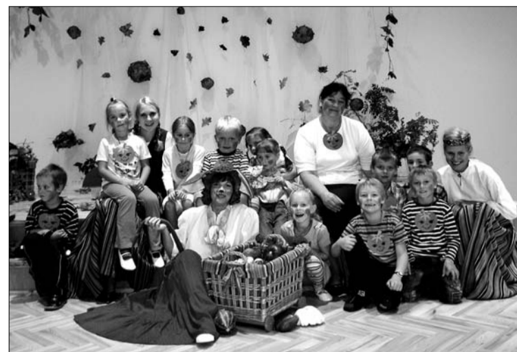
“Zemenītes” ar savām skolotājām...

nāca bērni, kas dāvināja Saimniecībām daļu no saviem dārzeņiem, pastāstot arī par to labajām īpašībām. Papildinājumu dārzeņu ražai varēja arī atrast mežā – improvizētā sēņošana. Bērniem bija jāatbild, kuras sēnes nesīs mā-