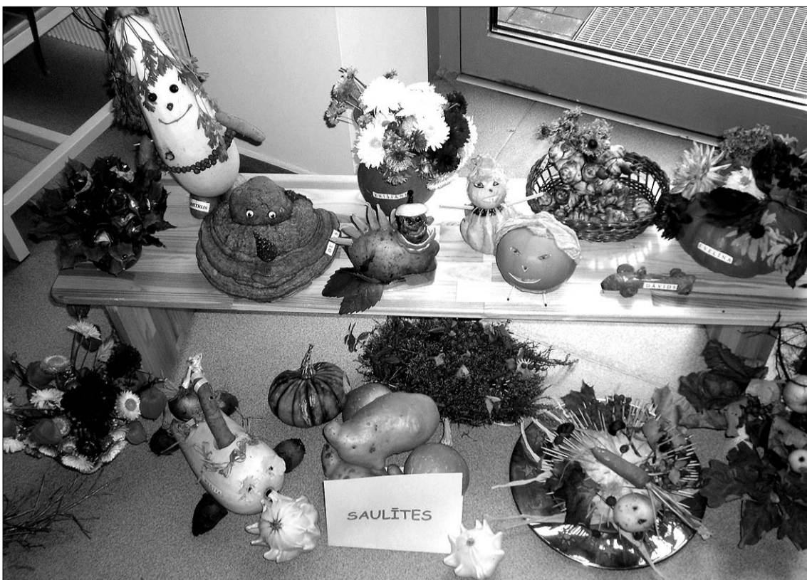
Rudens izstādē gozējās tēli no augļiem, ogām, dārzeņiem, zilēm, kastāņiem un piepēm.

“Miķeļos visai ražai jābūt zem jumta,” vēsta latviešu tautas paruna. Šā gada 28. septembrī atcerēties ticējumus, noskaidrot paražas, minēt mīklas pirmsskolniekus aicināja Jaunmārupes sākumskolas mūzikas skolotāja Sin-