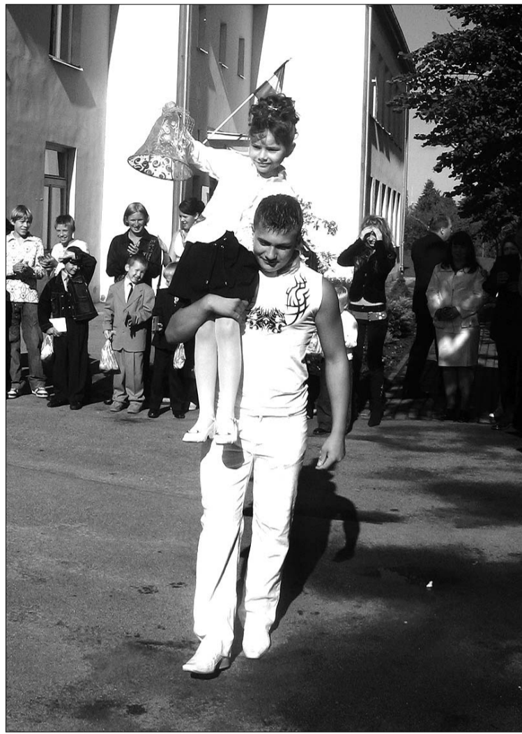
Tā pirmo skolas dienu ieskandināja Mārupes pamatskolā