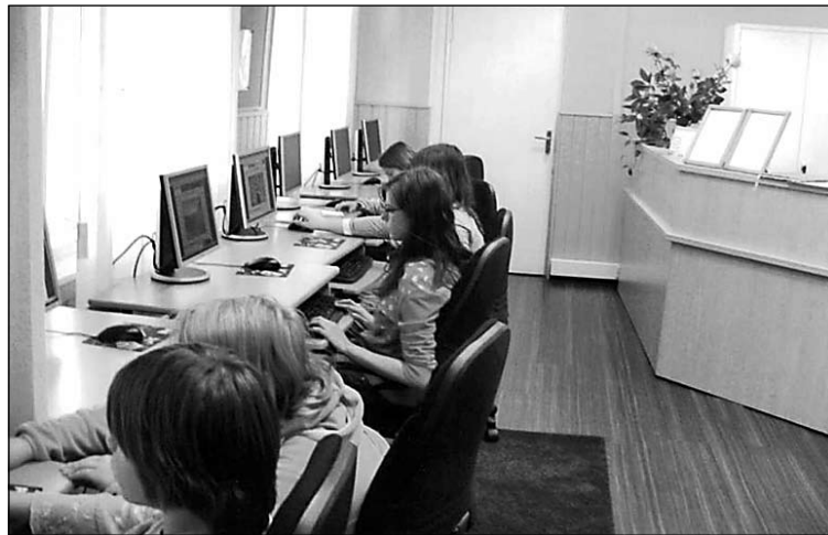
Bibliotēkā pieejamas jaunākās informācijas tehnoloģijas.