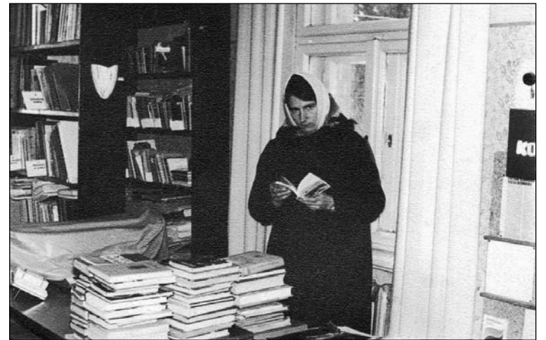
Mazcenas bibliotēka "Lielbēros" 1969.gadā. Saņemtas jaunās grāmatas.