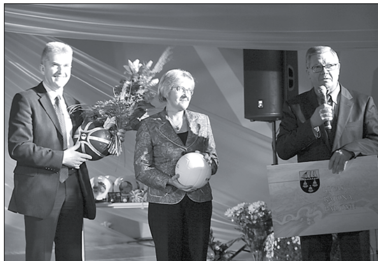
Mārupes pamatskolu sveic Rīgas rajona padomes priekšsēdētājs Tālis Puķītis (no kreisās), izglītības un kultūras pārvaldes priekšnieka vietniece Māriete Zaube un priekšnieks Oļģerts Lejnīeks.