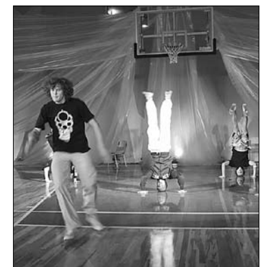
Jauno sporta zāles grīdu iemēģina Mārupes hip-hop dejotāji.

Šobrīd skolā ar katru gadu palielinās skolēnu skaits, tāpēc sporta zāles, ēdnīcas, kā arī papildu klašu telpu celtniecība kļuva par nepieciešamību, lai veiksmīgi varētu realizēt pamatizglītības programmu un nodrošinātu skolēniem atbilstošu vidi. Iespējama skolēnu skaits klasēs ir 20 skolēni, tāpēc kopējais skolēnu skaits nākotnē skolā nebūs vairāk par 180 skolēniem.