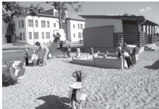
Jaunmārupes sākumskolas bērnu rotaļlaukums.

L. Kadīģe: – Mūsu pieredze liecina, ka no 21 audzēkņu grupiņā pieciem sešiem tiešām nepieciešama 12 stundu grupiņa, pārējie varētu apmeklēt septiņu stundu grupu.