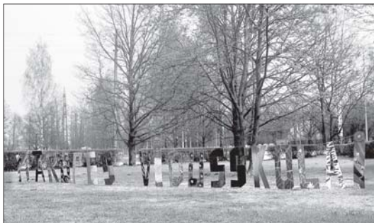
Veltījums skolas jubilejai.

No 24. līdz 28. aprīlim Mārupes vidusskolā norisinājās Mākslas dienas, zem kuru nosaukuma slēpās ne viena vien jaunietim saistoša nodarbe. Šajā pasākumā tika iesaistīti visi skolas skolēni un darbinieki.