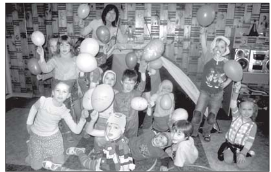
Joku diena PII "Lienīte".