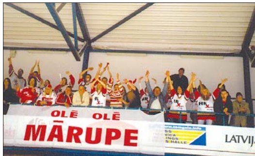
Mārupiešu fani tribīnēs.