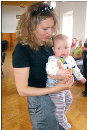
Paauģšos un nāksū arī es te rotaļāties!