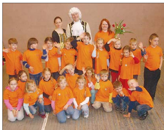
Jaunmārupes sākumskolas folkloras kopa.

Šie svētki mūsu bērniem bija pārdzīvojums, kuru ilgi atcerēties. Mums priekšā vesels gads, lai gatavotos nākamajam "Pulkā eimu, pulkā teku" sarīkojumam atkal citā Latvijas pilsētā.