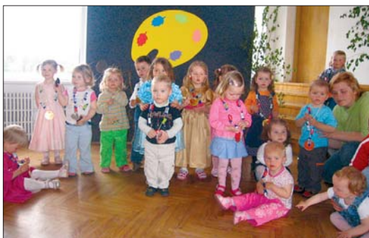
Rotaļu grupas izlaidums.