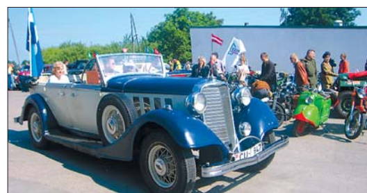
Antīkie auto pie Mārupes pagasta padomes. 2005

Otrajā gadā uz sezonas atklāšanas pasākumu "Retro Mārupe 2005" bija pulcējušās 63 auto un 32 moto ekipāžas, kopā ar līdz-