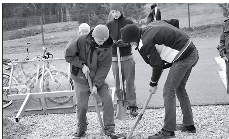
Zaļajā ceturtdienā 9. aprīlī pēc jauniešu iniciatīvas bērnu un jauniešu dienas centrs "Švarcenieki" rīkoja talku ar mērķi sakopt jaunizveidoto skeitparku un teritoriju ap to. 25 Jaunmārūpes jaunieši un bērni iebetonēja ar Mārūpes pagasta padomes gādību sarūpētos atpūtas soliņus, uzstādīja atkritumu urnas.