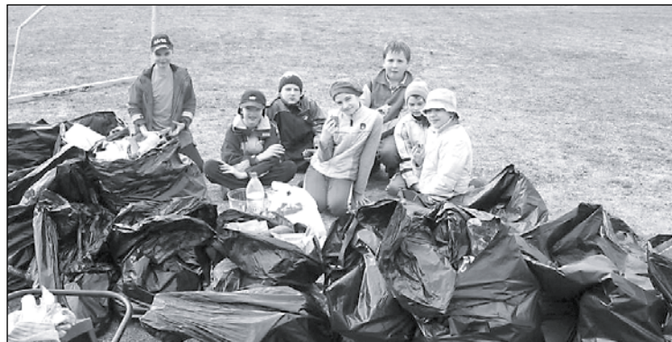
4.aprīlī Jaunmārūpē notika Jaunmārūpes sākumskolas 4a klases skolnieku organizētā talka apkārtnes sakārtošanai, kuras laikā tika sakopti Jaunmārūpes stadions, mežiņš pie ciemata, kā arī teritorija ap dīķi. Šīs talkas ideja bija radusies mācību stundā, bet padarītais ir artava lielajā kopdarbā – savākti 12 maisi atkritumu.

Neatkarīgi no tā, kādas motivācijas vadīti bija pulcējušies talcinieki, ieguvums ir mūsu krietni tīrāka un gaišāka kļuvusi Mārūpe! Paldies visiem, kas jau līdz talkai bez skaļiem uzaicinājumiem bija sakopuši savus īpašumus un piegulošās teritorijas.