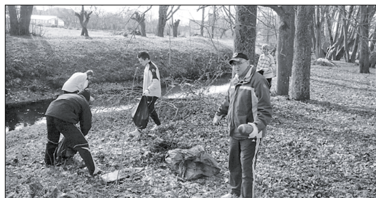
Lielās talkas dienā Mārupes jaunie futbolisti sakopa Mārupītes krastus.