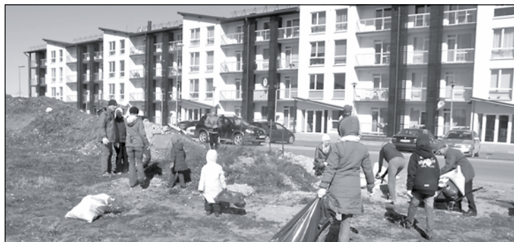
Lielu un mazi talcinieki strādāja Mazajā Spulgu ielā pie daudzdzīvokļu mājām.