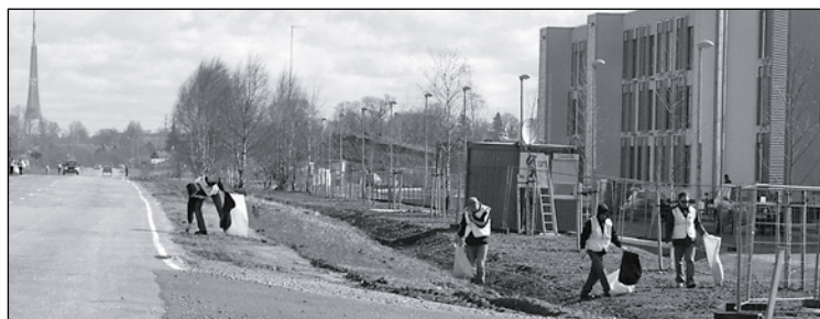
Autoceļa P132 nomales no Lielās ielas līdz Jaunmārūpei līdz vēlai pēcpusdienai kopa SIA "Witraktor" kolektīvs.